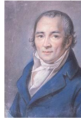
Johann Peter Hebel, Pastell von Philipp Jakob Becker (1807)